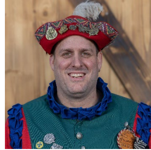
OK-Vizepräsident / Presse / Sponsoring