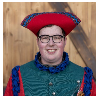
Verkehr / Sicherheit